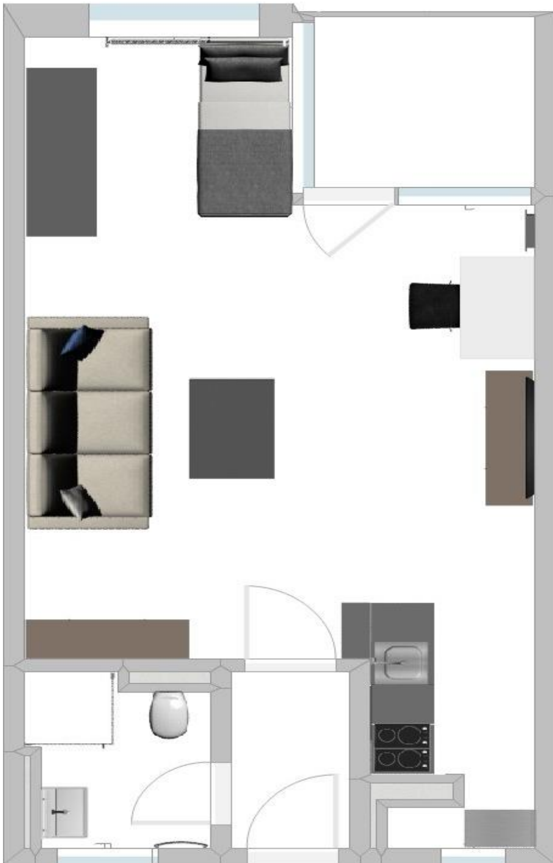
Grundriss mit Einrichtungsvorschlag. Vorhandene Einrichtung im Expose beschrieben.